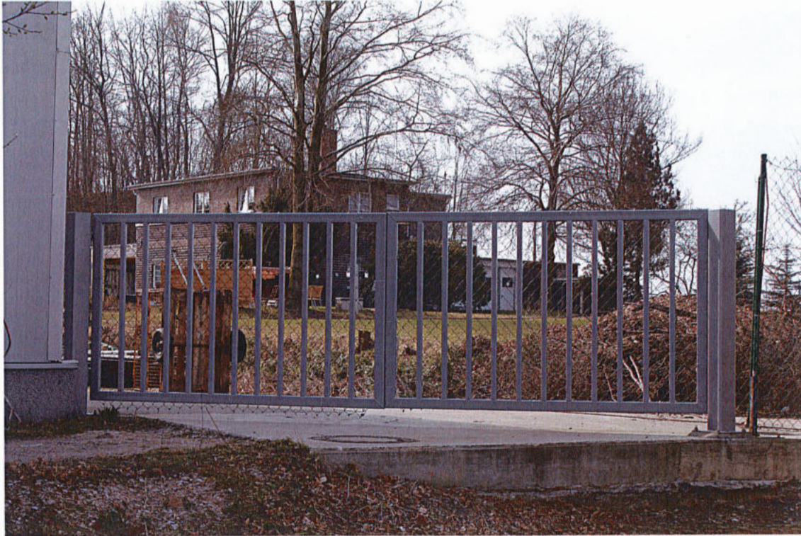
Bild 3: Immissionsort 4, Wohnhaus Firmeneigentümer Dresdner Straße 20